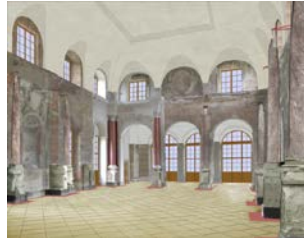
Gestaltungsvariante 3 mit und ohne aufgehellte Wandbereiche