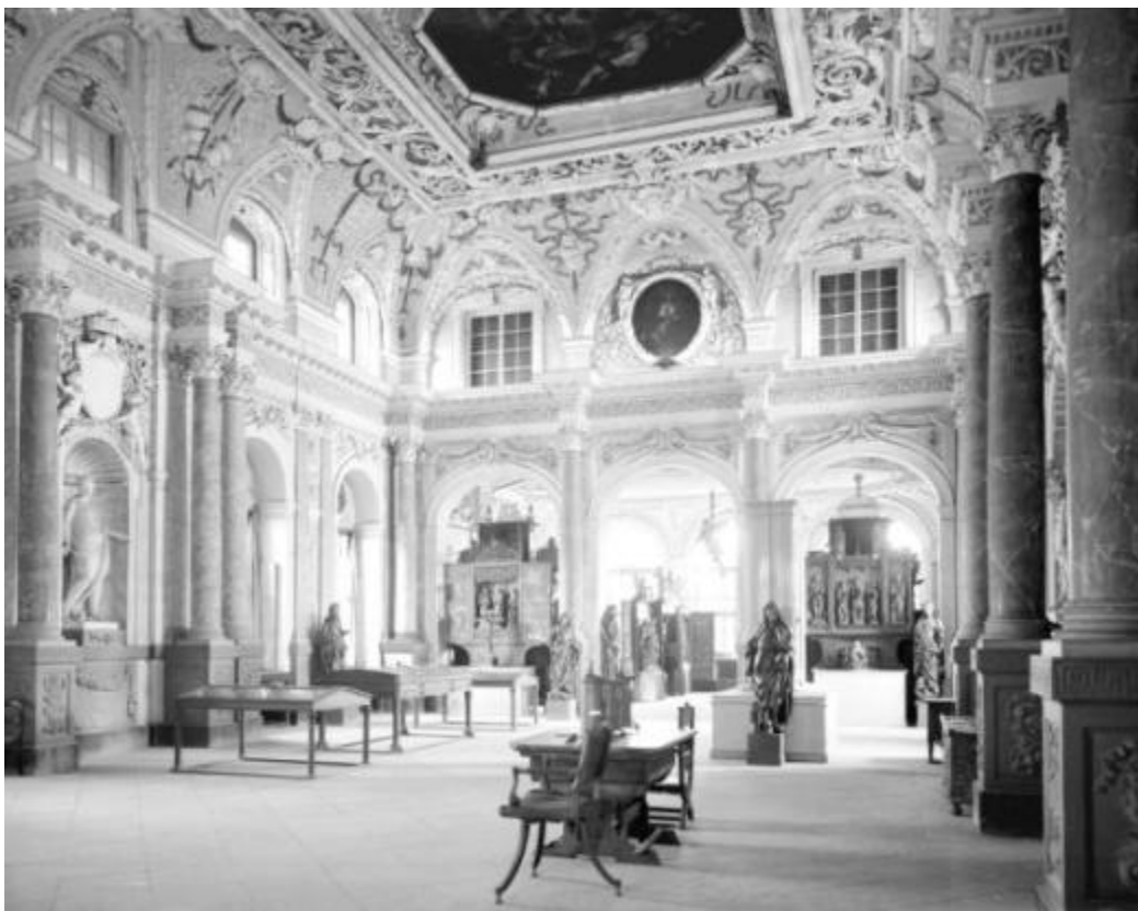
Historische Abbildung