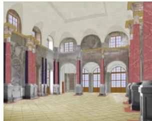
Gestaltungsvariante 4 mit und ohne aufgehellte Wandbereiche